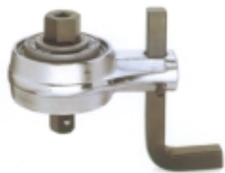
Pokrętło z przekładnią mechaniczną do zwiększania momentu obrotowego klucza

wych warto stosować rozwiązania techniczne skracające czas i poprawiające jakość wykonywanych czynności. Wykorzystują one z reguły zwykłe nasadki