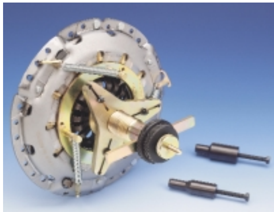
Specjalny przyrząd montażowy do sprzęgieł typu SAC