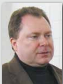
ZENON MAJKUT WIMAD SPÓŁKA JAWNA