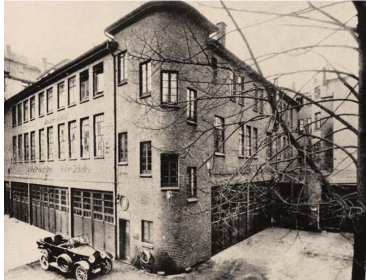
1921 R.: OD PIERWSZEGO SERWISU BOSCH W HAMBURGU FIRMA ROZPOCZĘ- ŁA TWORZENIE SIECI OBSŁUGI KLIENTÓW