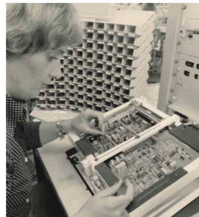
1978 R.: PRODUKCJA PÓŁPRZEWODNIKÓW DO ELEKTRONICZNEGO SYSTEMU WTRYSKU BENZYNY JETRONIC

Zgodnie z nim 92% udziałów w spółce Robert Bosch GmbH należy do fundacji Robert Bosch Stiftung GmbH. Jej prawem głosu dysponuje instytucja powiernicza Bosch Industrietreuhand KG, która pełni funkcje rynkowe tego udziałowca. Pozostałe udziały znajdują się w rękach rodziny Bosch oraz spółki Robert Bosch GmbH. Taka społeczno-prawna struktura zapewnia Grupie Bosch niezależność od doraźnych układów poli-