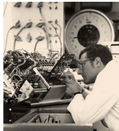
1970 R.: STANOWISKO POMIAROWE ELEKTRONIKI STERUJĄCEJ DO SAMOCHODU ELEKTRYCZNEGO

Wybitna osobowość założyciela w połączeniu ze światowym niemal od początku zasięgiem handlowych i badawczo-rozwojowych powiązań firmy przyniosły w efekcie niepowtarzalną koncepcję organizacji gigantycznego przedsiębiorstwa i jego zawsze wyprzedzającej współczesność strategii działania. Robert Bosch nie miał żadnego oficjalnego wykształcenia. Uczył się przez całe życie sam, lecz zawsze od najlepszych. W młodości odbył w tym celu wiele krajowych i zagranicznych podróży, w trakcie których jako wolny słuchacz uczestniczył w zajęciach akademickich. Jako robotnik pracował m.in. u Siemens