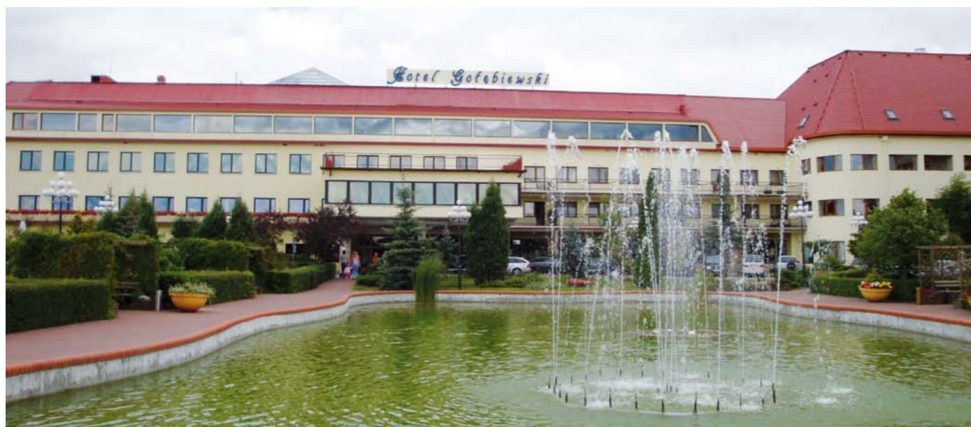
Dla 500 najlepszych luksusowy weekend 13-15 maja 2011 w hotelu Golebiewski w Mikolajkach!