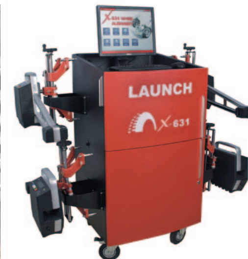
SYSTEM KOMPUTEROWY Z TRANSMISJĄ BEZ- PRZEWODOWĄ I KAMERAMI CCD