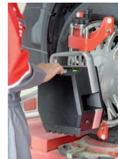
KLASYCZNY SPOSÓB MOCOWANIA GŁOWICY DO OBRĘCZY KOŁA

Kompensacja przez obrót uniesionego koła o 180° jest standardowym trybem pracy realizowanym w pełnym cyklu pomiaro-