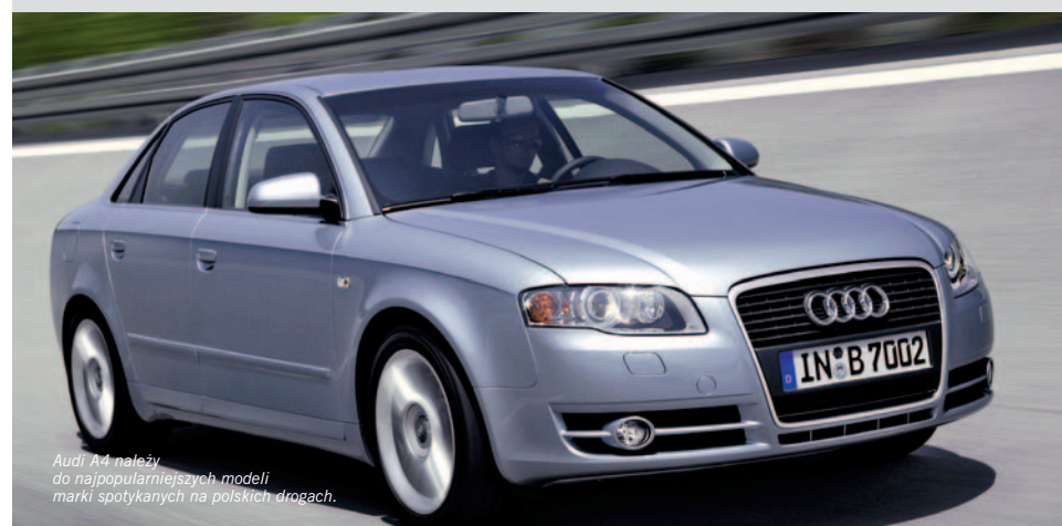
Audi A4 należy do najpopularniejszych modeli marki spotykanych na polskich drogach.