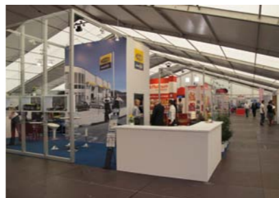
POD WZGLĘDEM ESTETYKI I KOMFORTU NOWOCZESNE NAMIOTOWE HALE NIE USTĘPUJĄ W NICZYM TRADYCYJNYM STAŁYM OBIEKTOM TARGOWYM

Jeśli nawet taką racjonalną optymalizację rynkowej obecności inspirował w pewnej mierze kryzys gospodarczy, który nie oszczędza przecież światowej branży motoryzacyjnej, to jego wpływ jest tutaj wyraźnie pozytywny, gdyż konieczne oszczędności zachęcają przedsiębiorców, by uszczuplone środki wykorzystywać bardziej efektywnie. Optymizm przejawiany w takich warunkach nie może być „lekki, łatwy i przyjemny”, lecz opiera się zwykle na solidnych przesłankach i targowych kontaktach i jako taki udziela się przeważnie zaniepokojonym ogólną