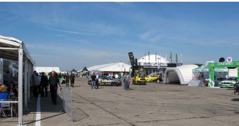
WRAZ Z PRZENIESIENIEM NA WARSZAWSKIE LOTNISKO BEMOWO TA CYKLICZNA IMPREZA NABRAŁA NOWEGO, W PEŁNI PROFESJONALNEGO ROZMACHU