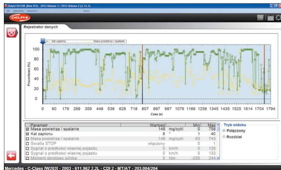
PARAMETRY RZECZYWISTE ZAPISANE PRZEZ REJESTRATOR FLIGHT RECORDER MOGA BYĆ WYŚWIETLANE W FORMIE WYKRESU LUB/I LISTY