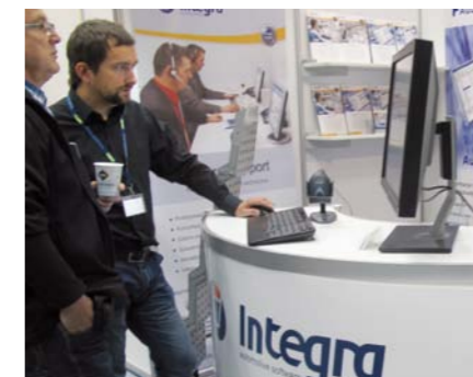
TAKŻE OPROGRAMOWANIE NAJŁATWIEJ JEST OCENIĆ PODCZAS PRAKTYCZNEJ PRÓBY