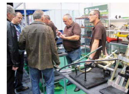
SPECJALISTYCZNE NARZĘDZIA FIRMY TESAM MOŻNA BYŁO ZOBACZYĆ W AKCJI