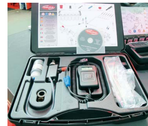
ZESTAW DIAGNOSTYCZNY DELPHI DLA AUTORYZOWANYCH STACJI

staniu naszych wtryskiwaczy, odpowiadających jakością wyposażeniu fabrycznemu. Produkowane przez Delphi wtryskiwacze EUI E3 o podwójnych zaworach, przeznaczone dla silników Diesla, zapewniają dużą szybkość działania i niezawodną pracę przy bardzo wysokich ciśnieniach roboczych. Charakte-