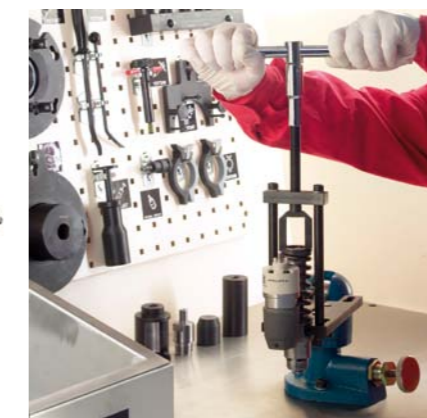
STANOWISKO MONTAŻOWE W AUTORYZOWANYM WARSZTACIE DELPHI