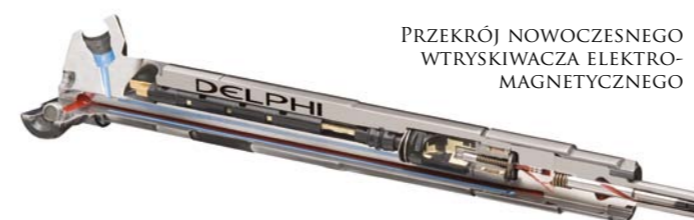
PRZEKRÓJ NOWOCZESNEGO WTRYSKIWACZA ELEKTROMAGNETYCZNEGO

Delphi zapewnia swojej sieci stowarzyszonych warsztatów całe niezbędne w tym celu wyposażenie diagnostyczne, części zamienne, szczegółowe instrukcje i specjalistyczne szkolenia. Kursy szkoleniowe są organizowane regularnie we wszystkich akademiach Delphi Diesel Aftermarket na całym świecie, a przedstawiciele zainteresowanych warsztatów są zobowiązani do uczestnictwa w ich