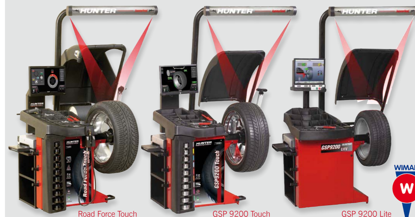
Road Force Touch