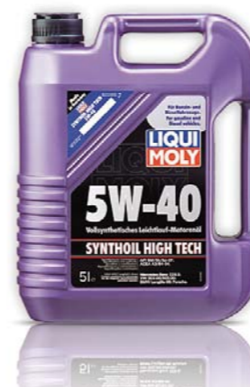
TYLKO OLEJE RZECZYWIŚCIE SYNTETYCZNE TAK SĄ NAZYWANE NA SWYCH ETYKIETACH. GDYŻ FIRMA LIQUI MOLY NIE PROWADZI W TEJ KWESTII ŻADNEJ GRY POZORÓW