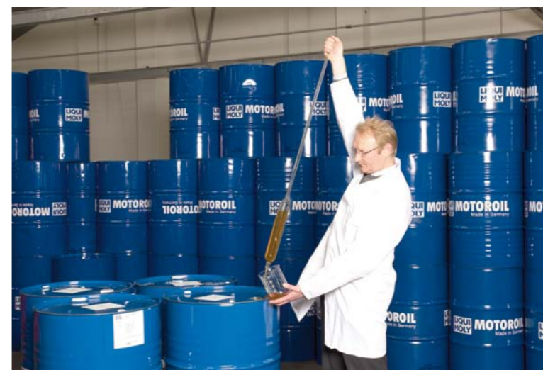
KONTROLA SKŁADU I WŁAŚCIWOŚCI OLEJU ODBYWA SIĘ NA WSZYSTKICH ETAPACH JEGO PRODUKCJI, TAKŻE TUŻ PRZED WYSYŁKĄ DO KLIENTÓW