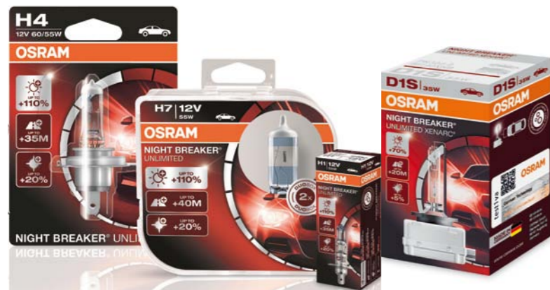
PRODUKTY SERII NIGHT BREAKER UNLIMITED. DOSTARCZANE W CZERWONYCH OPAKOWANIACH. CECHUJE NAJSILNIEJSZE OŚWIETLENIE DRÓGI