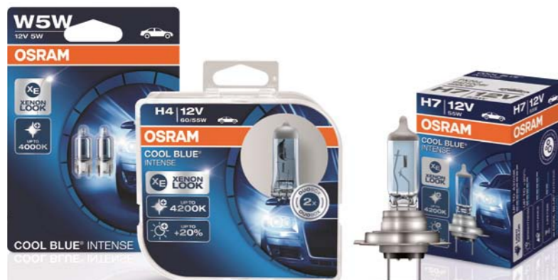
ŹRÓDŁA ŚWIATA Z „NIEBIESKIEJ” RODZINY COOL BLUE INTENSE WYRÓZNIAJĄ SIĘ STYLOWĄ, BŁĘKITNĄ BARWĄ ŚWIATAŁA

Z kolei kierowcy, którzy przywiązują szczególną wagę do trwałości i niezawodności, a jeżdżą głównie w dzień i po oświetlonym nocą mieście, w dodatku samochodami, w których samodzielna wymiana żarówki jest wyjątkowo trudna, wybierają zazwyczaj produkty trwałe i ekonomiczne. Także dla nich firma Osram ma w swojej ofercie odpowiednie produkty w serii Ultra Life. To szeroka gama żarówek halogenowych, pomocniczych, a już wkrótce także lamp ksenonowych. Wszystkie wyróżniają się niezwykłą wręcz trwałością – z żarówkami Osram Ultra Life H4 można przejechać nawet 100 tys. km, a z lampami ksenonowymi Osram Xenarc Ultra Life – ponad 300 tys. km. Co więcej, na wszystkie produkty z tej serii producent udziela kilkuletniej gwarancji.