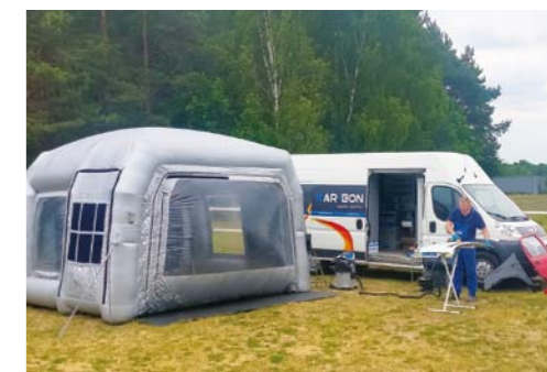
MOBILNE CENTRUM SZKOLENIOWE PROFIX ROZWIĄDUJE PROBLEMY LAKIERNIKÓW W DOWOLNYM MIEJSCU I CZASIE