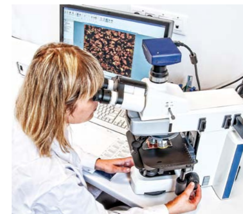
W FIRMOWYM LABORATORIUM POWSTAJĄ I SĄ DOSKONAŁONE KOLEJNE TECHNOLOGIE LAKIERNICZE

kich porównywalnych ofert. To my ułatwiamy mu ten wybór w sposób najbardziej praktyczny – za pomocą naszego Mobilnego Centrum Szkoleniowego, docierającego bezpośrednio do potencjalnych użytkowników w różnych rejonach kraju, w dowolnym miejscu i czasie. Mobilne Centrum wyposażone jest w przewoźną, w pełni funkcjonalną kabinę lakierniczą oraz w system doboru lakierów samochodowych. Prowadzimy też profesjonalne spotkania w Centrum Szkoleniowym Profix, gdzie lakiernicy mogą testować różne nasze wyroby i dokładnie zapoznać się z ich właściwościami.