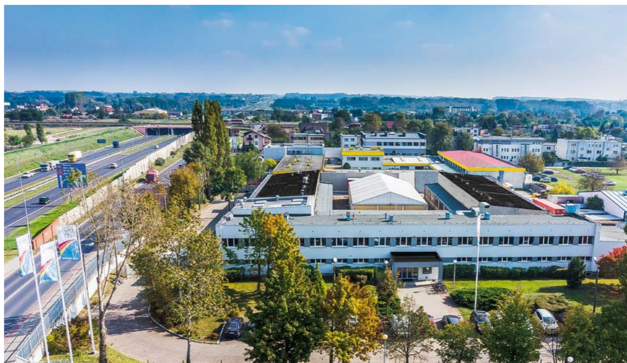
OBECNA LOKALIZACJA FIRMY UŁATWIA JEJ HANDLOWE KONTAKTY Z KLIENTAMI W CAŁEJ EUROPIE

Chyba tak, choć ważne znaczenie ma także ewolucyjna ciągłość i gromadzenie zdobytych doświadczeń. Firma, założona we wrześniu 1996 roku, w pierwszej fazie działała tylko w zasięgu lokalnym. Swoją pierwszą siedzibę miała