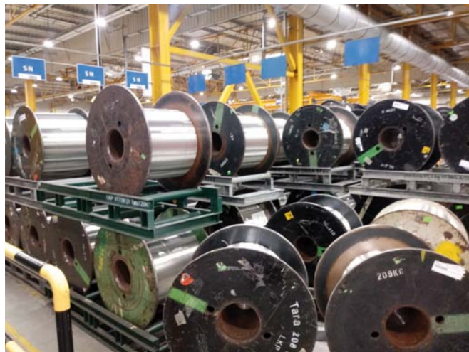
MIEDZ CORAZ CZĘŚCIEJ ZASTĘPUJE SIĘ LŹEJSZYMI ALTERNATYWNYMI PRZEWODNIKAMI (NP. ALUMINIUM LUB STOPAMI MIEDZI ZE SREBRZEM BĄDŹ MAGNEZEM)