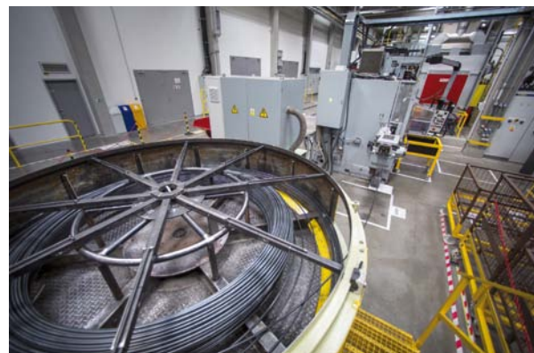
KCME – MASZYNA PROSTUJĄCA ZWOJE DRUTU SPRĘŻYNOWEGO