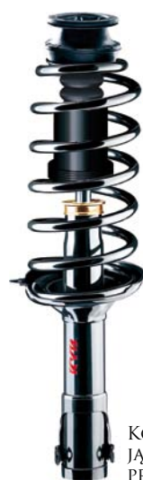
KOMPLETNA KOLUMNAMORTYZUJĄCO-RESORUJĄCA DOSTARCZANA PRZEZ ZAKŁADY KYB W PARDUBICACH

wać wirtualne otoczenie z wnętrza dwóch prezentowanych samochodów wykonujących różne manewry. Pierwszy pojazd ma przebieg 80 000 km i zużyte amortyzatory, drugi jest wyposażony w nowe amortyzatory KYB. Obserwator łatwo może zauważyć różnice w zachowywaniu się tych samochodów.