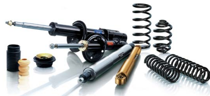
ELEMENTY ZAWIESZEŃ SAMOCHODOWYCH PRODUKOWANE W CZECHACH PRZEZ FIRMĘ KYB