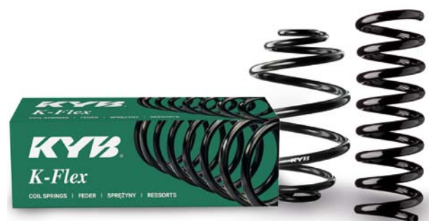
RODZAJE SPRĘŻYN ZAWIESZEŃ PRODUKOWANYCH W PARDUBICACH