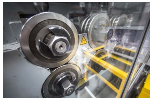
KCME – MASZYNA FORMUJĄCA ZWOJE SPRĘŻYN SPIRALNYCH