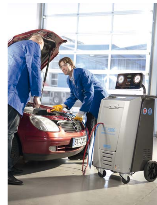
ROŚNIE NATOMIAST BARDZO DYNAMICZNIE POPULARNOŚĆ USŁUG ZWIĄZANYCH Z SERWISOWANIEM KLIMATYZACJI

Przedstawiciele średnich serwisów dbają także o zatrudnionych pracowników. 71% z nich często korzysta ze szkoleń o tematyce nie tylko technicznej, lecz również z zakresu zarządzania i organizacji pracy. Udział warsztatowego personelu w szkoleniach przekłada się na zaangażowanie w tworzenie oferty dopasowanej do potrzeb klientów. Dzięki temu 90% średnich warsztatów serwisuje sa-