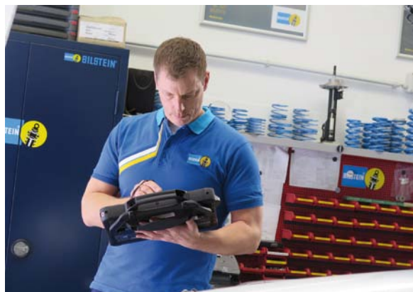
AKTUALNY KATALOG BILSTEIN POZWALA DOBIERAĆ CZĘŚCI DO KILKUDZIESIĘCIOLETNICH ZAWIESEŃ