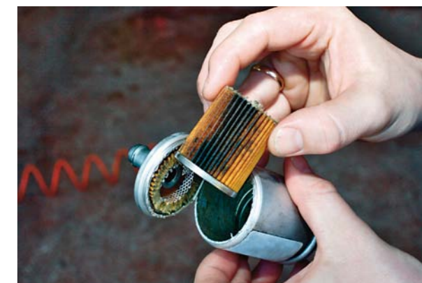
WNĘTRZE FILTRA LPG PO PRZEBIEGU 20 TYS. KM

Nie można też zapominać, że stary filtr kabinowy jest siedliskiem bakterii i grzybów, które wydzielają przykre za-