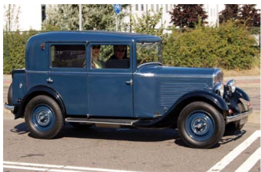
Peugeot 201 (1929)