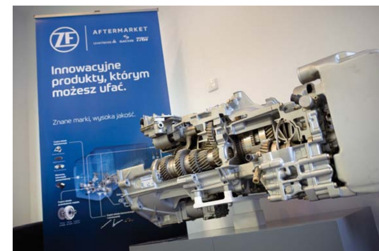
W 2022 ROKU ZF AFTERMARKET WPROWADZI TRZY NOWE SZKOLENIA W RAMACH KONCEPTU ZF [PRO]TECH

który towarzyszy całej ofercie konceptu ZF [pro]Tech, jest przygotowywanie partnerów warsztatowych do technologii przyszłości i mobilności nowej generacji. Cieszymy się, że mamy do dyspozycji profesjonalne miejsce, które umożliwia nam realizację tych celów na najwyższym poziomie. Więcej informacji o ofercie ZF Aftermarket oraz koncepcie warsztatowym ZF [pro]Tech można znaleźć na stronie protech.zf.com .