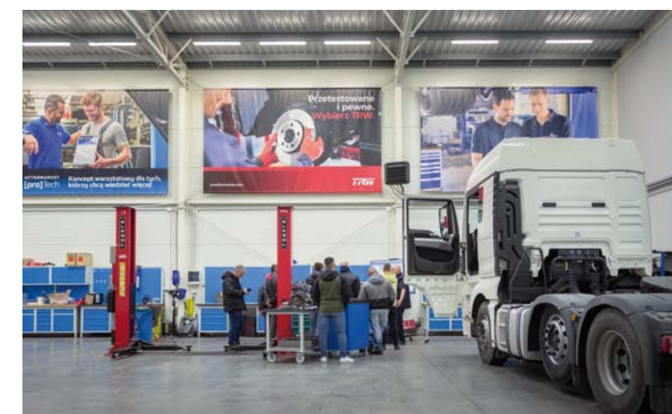
W LISTOPADZIE 2021 ROKU ODBYŁO SIĘ PIERWSZE DWUDNIOWE SZKOLENIE Z ZAKRESU DIAGNOSTYKI POJAZDÓW UŻYTKOWYCH